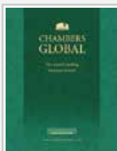
《钱伯斯全球 法律排名2019》